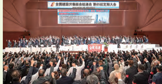
▲ 団結ガンパロウコール