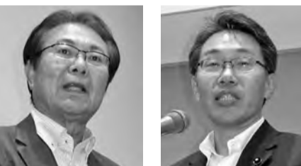
青柳正司 県議会議員