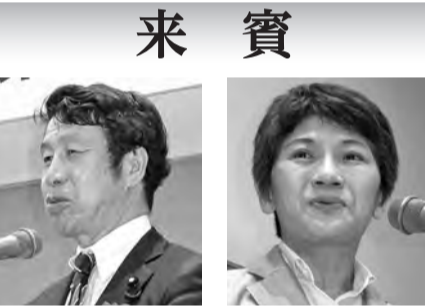
米山隆一 衆議院議員