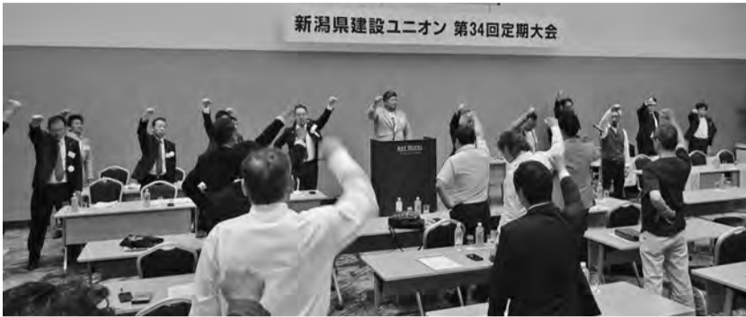
最後に「団結ガンパロー」を三唱する参加者たち

6月22日(日)、アイトホテル新潟駅前にて新潟県建設ユニオン第34回定期大会を開催し、代議員52名(内委任状32名)、傍聴人5名、県本部役員16名、書記局員3名、来賓8名の総勢52名が参加しました。