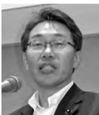
上杉知之 県議会議員