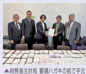
▲財務省主計局 要請ハガキの前で手交