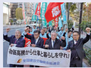
▲シュプレヒコールでアピール